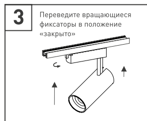
Рис. 3. Установка и подключение светильника